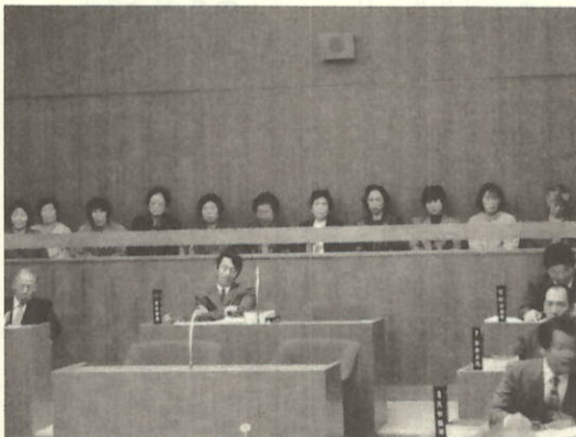
熱心に聞き入る女性グループの皆さん

12月17日から3日間の会期で開かれた定例町議会で、議員定数の減少案など15案件が審議され、平成9年度