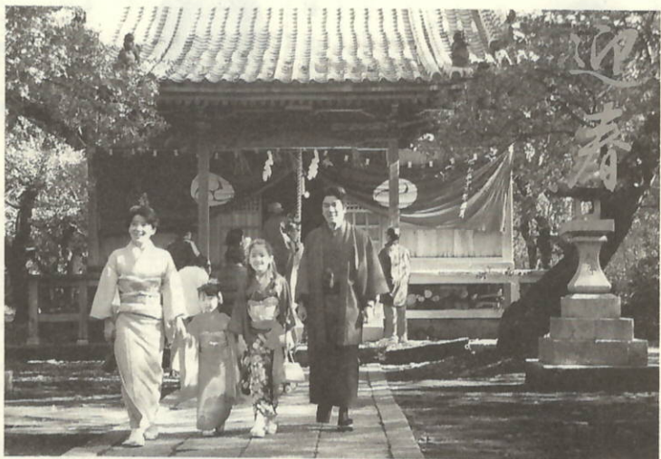
三机 八幡神社にて