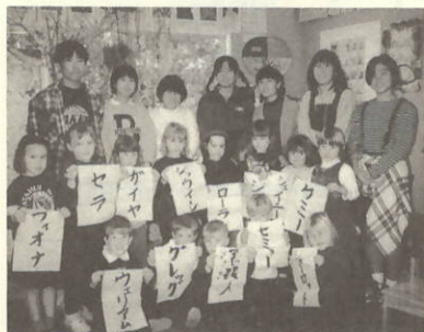
マタフィロードスクールで