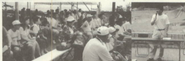
河野さんの講演に聞き入る参加者の皆さん