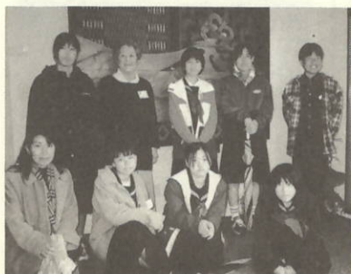
インフォメーションセンター(総合案内所)

短い期間での海外研修でしたが、生徒達にとっては良い思い出、経験になり大きく成長したように思います。また、最高の夏休みになったのではないのでしょうか。