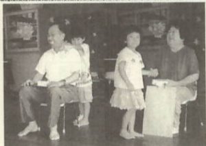
おじいちゃん、おばあちゃん、とってもうれしそうです。