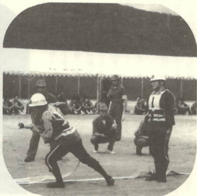
第11分団 放水はじめ

八西大会に先立ち、7月27日(日)に、瀬戸中学校グラウンドで町大会が開催されました。雨天の為、午後からの開催となりましたが、小型ポンプの部9チーム、ポンプ車の部2チームが出場しました。 審査結果は次のとおりです。 ○小型ポンプの部 1位 第8分団(川之浜) 2位 第11分団(神崎) 3位 第10分団(田部) ○ポンプ車の部 1位 第1分団(三机)