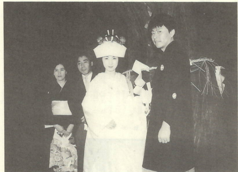
御神木の前で永遠の愛を誓うふたり