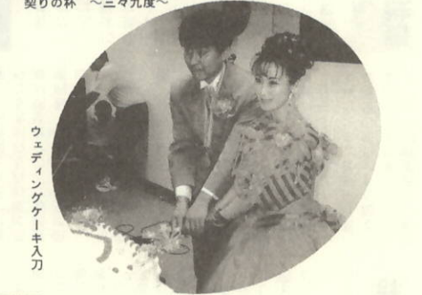
ウェディングケーキ入り

手づくりの暖かさ、楽しさを心ゆくまで味わわせていただきました。須賀公園が挙式に相応しい神聖な場所であること。美しい瀬戸の自然をバックスクリーンにするアイデアの面白さ等既成のものを見慣れた目には、とても新鮮に映りました。時ならぬ雷雨までも、スタッフの機敏な対応でイベントの程良いスパイスになったようです。継続は力です。この新企画の発展に大いに期待しております。