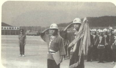
町大会優勝 第8分団