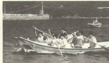
大瀬中の生徒さんも 手こぎボートレースに参加

「友達できた？」 大瀬中学校との交流学習で 少しつかれた夜に、私は瀬 戸の友達と話をしていました。 私は、それまで全く大 瀬の人と交流はありません でした。 「やっぱり、ホームステイ 先の人とは仲良くなりました いよね。」 私が泊まる部屋では12人が ねていました。そしてお風 呂を出て何分かつて落ち ついたところに、大瀬の人と 少しずつ話をしました。そ してサイン帳を書いたりお たがいの学校のことを話し たりして、とても楽しかつ たです。大瀬の人たちはと てもおもしろくて、すごく 話はずみでした。夜だっ