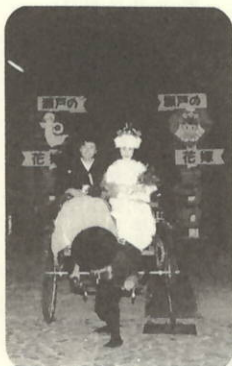
挙式会場の須賀公園へ

愛媛・岡山の両瀬戸町が交流を始め、本年度10年になりました。この記念すべき年に「手づくり結婚式」というすばらしい企画が新たに加わり「花嫁が舞い降りるまち」瀬戸町のキャッチフレーズにふさわしい心温まる内容で開催され、感激いたしました。