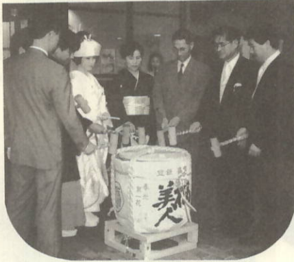
開幕セレモニー 饅開き

御縁というものは、不思議なものですね。全国300もある市町村の中、瀬戸町でも挙式し、花嫁まつりに参加できた事は奇蹟に思います。エッセイコンテスト最優秀賞の連絡を頂いた時は、天にも昇る気持ちでした。実際瀬戸町に訪れ、町民の皆様温かみは一生忘れません。第2の故郷として、全国にPRさせて頂きます。