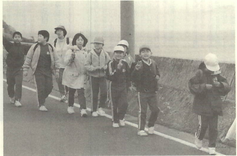
お別れ遠足 (塩成小学校)