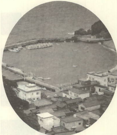
四ツ浜(川之浜)漁港