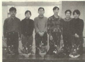
それぞれの思いでいけ花にも挑戦

町でも数年前から中学生や住民の海外研修支援を行っていますが、今後は双向交流を進め、多くの人達が日常生活の中で外国の文化を学んだり、触れ合ったりする機会を作りたいと考えています。