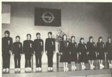
一人ひとり決意を発表

って一時間ぐらいは勉強し たいと思います。それと予 習や復習もしようと思いま す。今までは、家に帰ると すぐテレビを見てやらない 日が多かったのでやるうと 思います。 部活ではもう大会が近い ので、レシーブやアタック やサーブのミスなどを少な くして勝ちたいと思います。 以上のことを今年がんば りたいです。