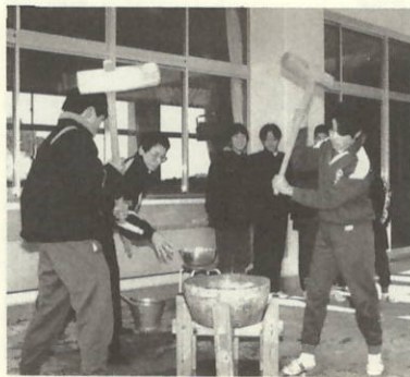
息をあわせてベッタン・ベッタン

少しでもできるようになり たいです。僕の今年の目標 は、勉強をがんばることで す。だから今まで以上に勉 強に集中して、家庭学習も きちんとしたいです。 三つ目は自覚です。僕は 自分に責任を持てるよう にしたいです。だから、自分 でできるだけのようになし たいです。人に言われたこ とは、きちんと最後までや りとげるようにしたいと思 います。 そして、社会から信頼さ れる大人になれるよう一生 懸命ががんばりたいです。