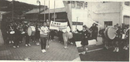
三机小学校 大久小学校