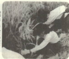
お米たくさんとれたよ

岡山県瀬戸町で、この程小学校六年生による稲刈り体験交流会が行われました。かまを扱うのは初めての児童がほとんどで、最初はごっこな手つきでしたが、地元の方のアドバイスも手伝って次第に要領を得て、たわわに実った七アールの田んぼを刈り終えました。