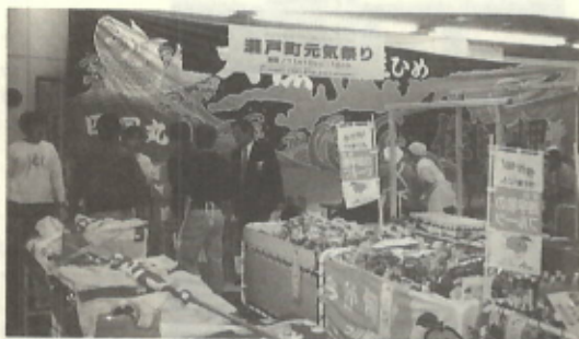
40周年記念物産展(松山ニチイ)