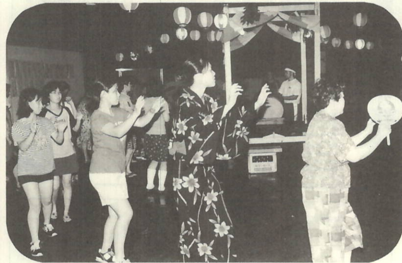
神崎地区盆おどり