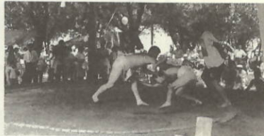
ハックヨイ 会場をわかせて青年相撲

後も炎の祭典に使用した空き缶の回収など夜遅くまでガンバリました。当日、裏方でイベントを支えてくれた皆さんや財源支援をいただいたスポンサー各位に、紙上をお借りして厚くお礼を申し上げます。実行委員会では、さつそく来年に向けての検討会をスタートします。ユニークなご提案やご意見をどしどしお寄せ下さい。