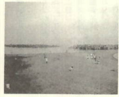
きれいになったネノ

暑期中、参加された皆さん、大変御苦労様でした。今後とも海を愛する活動を町民一体となって頑張りましょう。