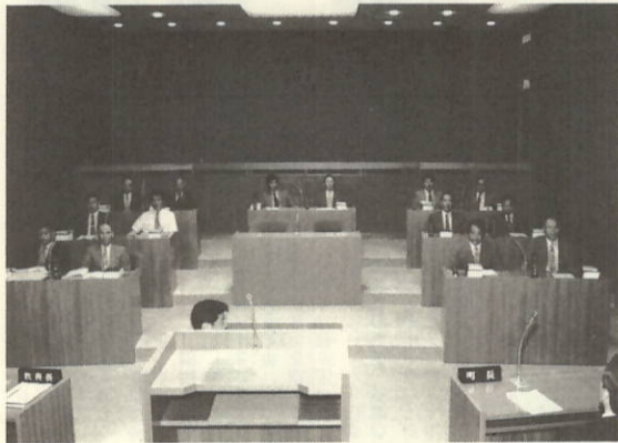
改選後初の瀬戸町議会 第247回臨時議会

七月十九日に告示された瀬戸町議会議員選挙は、定数十四人に対し、同数の立候補者となり、同月二十五日に開催された選挙会で立候補者全員の無投票当選が決定しました。 新議員の内訳は、現職十二人、新人二人で任期は平成十二年七月三十一日までの四年間です。