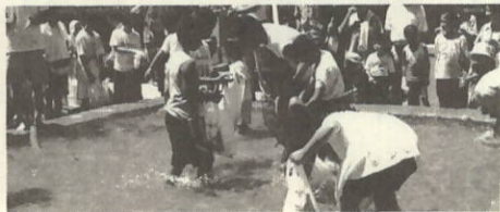
あじ、たこ、うなぎが一杯なのに なかなかつかめないよー