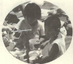
兄弟仲良く 水もおいしいよ