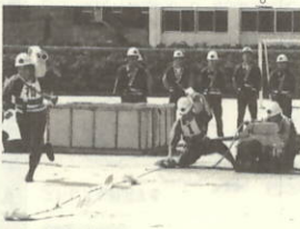
町大会 第8分団の小型ポンプ操法

八月十一日(日)、真夏の日射しの中、三崎中学校グラウンドで第三十六回八西消防操法大会が開催されました。小型ポンプ操法の部に十二チーム、ポンプ車操法の部に六チームが出場。本町からも三チーム出場し日頃の練習の成果を発揮して素晴らしい操法が繰り広げられました。 審査の結果、本町第一分団(三机)がポンプ車の部で見事優勝、小型ポンプの部は第八分団(川之浜)が三位に入賞、第九分団(大久)も五位と健闘しました。優勝した第一分団は、九月八日松山市で開催される県大会に出場します。長期間の練習になりすがさらに訓練され、迅速かつ的確な操法をめざして頑張ってください。