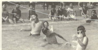
水上大運動会 パン食い競争だよ