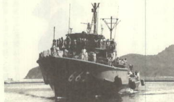
体験航海を終え無事帰港