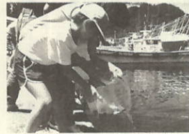
タイの稚魚放流 大きく育て