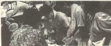
チリメン井どうぞ

お知らせと共に厚くお礼申し上げます。 今後も皆様に親しまれる漁協でありますよう努力して参りたいと考えておりますのでよろしくお願致します。