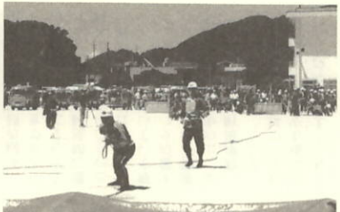
八西大会での第8分団 火点へ放水