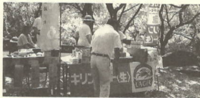
岡山県瀬戸町からも物産販売に参加

八月四日(日)は、主会場を須賀公園に移し「瀬戸の花嫁まつり'96」を開催。今年で11回目を迎えるこのイベントを盛り上げようと実行委員会を中心に各コーナードでスタッフが大健闘。PR不足か、例年に比べ参加者が少なかった様ですが、趣向をこらしたプログラムに参加者はけっこう楽しんでいました。スタッフは海上花火終了