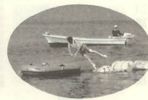
海上ジャンピング パイの上を走ってポートへノ