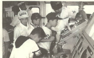
船長さん だいじょうぶ?

町制施行40周年を祝い、八月一日から三日間、海上自衛隊掃海艇「ひめしま」が三机港に入港しました。期間中のメイン行事は体験航海。海に囲まれた町に生まれ、海といっしょに大きくなった子供達も、沖から瀬戸町を見るのはめったにないチャンス。双眼鏡を眺めたり、艇内を走りまわったりで、あっという間の一時間でした。身近で雄大な海を体感し、ふるさと瀬戸町への愛着や豊かな自然への感謝の気持ちが増えることを願っています。