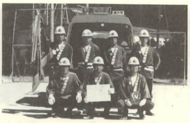
ポンプ自動車の部で優勝した第1分団