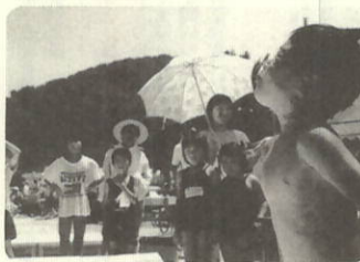
すいかの種とばしだよ