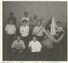
優勝旗を囲んで喜びの瀬戸チーム