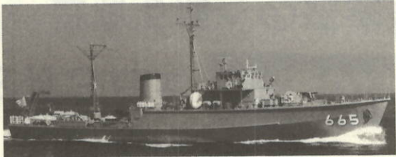
海上自衛隊第19掃海隊掃海艇「ひめしま」