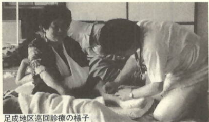
足地区巡回診療の様子

町民の要望に答えるべく、本年四月から医師の増員看護婦等の増員を行い、各地区への巡回診療で対応しています。 病気が予防に始まり、早期発見、早期治療が要求されます。 「体調が変だなあ」と感じた時は、早めに先生に相談しましょう。 巡回診療に訪れた患者さんにご意見、ご感想をお伺いしました。