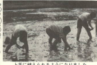
上手に植えられるようになりました

*田植えはわたしたちにとって初めてだったので、すごくドキドキしました。少しずつやっているうちに、うまくできるようになりました。岡山県のおじさんに「上手、上手」とほめられたのでとてもうれしかったです。