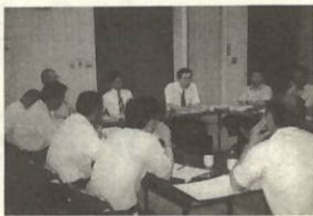
第2回中山間地域活性化推進協議会

● 高齢化に伴い、今までの家族、親族で守ってきた農地が増えている状況になってきた。年々、荒廃園が増加している中、農地の流動化が急務である。 ● 高齢化・兼業化の中で、オーナー制等について検討してみようか。 ● 後継者が残る為の樹園地