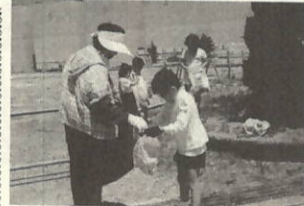
たくさん拾ったネ!

ボランティアは、人間の優しさ、自分の技能を生かして地域のために自ら行動する勇気ではないでしょうか。今、この広報を読んでいる皆さん、今からでも遅くありません。一語にボランティアしませんか。