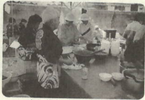
老人、婦人パワーも加わって

今年で二回目となったこのイベントの悩みはスタッフ不足でしたが、「若い者が頑張っているのに、知らん顔は出来な」と老人クラブ・婦人会等の助け人も加わり、昨年にも増してに