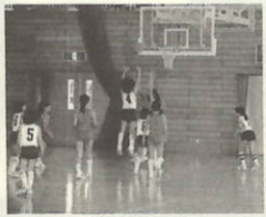
おもいきってシュート