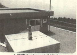
大江第三ブロック制御室

第四ブロックも七月上旬には完成の見込みであり、大江地区の農業が大きく変わろうとしています。農家のみなさんがんばつて!!