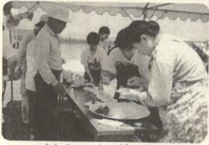
さしみコーナー(食べ放題)

ぎやかな一日になりました。スタッフのみなさんご苦労でした。これからも元気なところを見せてください。