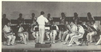
熱演する音楽隊の皆さん