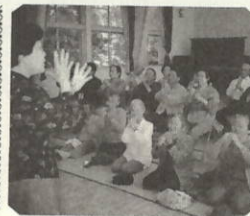
みんなで楽しくゲーム