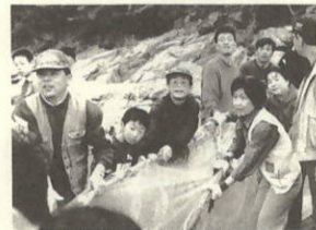
力を合わせて とれてるといいなー

恒例となったVA大久主 催による春の「海のつじい」が五月四日(フェイツシュの日)大久西海岸で開催され、約四百人の参加者でにぎわいました。心配されていた空模様も、地引網の終了までは何とか持ち、バーベキューコーナー等はテントの中での実施となったものの、瀬戸アジ・鯛めし・金太郎いも・地ダコ等地元産品のフルコースで満腹となった町外参加者の中から、「次はいつするの?」という声が聞こえました。