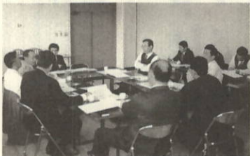
4月26日 中山間地域活性化推進会議

ソフト事業として営農環境の整備、就労機会の創造や地域リーダーの育成等の支援を行うため、「瀬戸町中山間地域活性化推進基金(基金額)一四、七〇〇千円」を創設しました。ソフト事業の推進母体として、農業関係者からなる「瀬戸町中山間地域活性化推進協議会」を結成。四月二十六日に推進会議