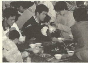
とれたての魚 焼けたかな

恒例となったVA大久主 催による春の「海のつじい」が五月四日(フェイツシュの日)大久西海岸で開催され、約四百人の参加者でにぎわいました。心配されていた空模様も、地引網の終了までは何とか持ち、バーベキューコーナー等はテントの中での実施となったものの、瀬戸アジ・鯛めし・金太郎いも・地ダコ等地元産品のフルコースで満腹となった町外参加者の中から、「次はいつするの?」という声が聞こえました。