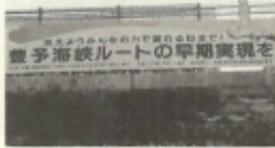
ジャンボ風車の下に設置

この豊予海峡ルートは、「二十一世紀のビッグプロジェクト」として国の太平洋新国土構想に位置付けられており、人、物、経済の交流促進のため早期実現を九州の人達と力を合せて推進するものです。