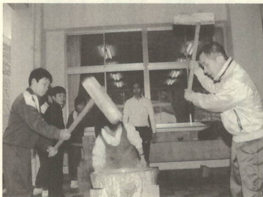
息を合わせてベッタン