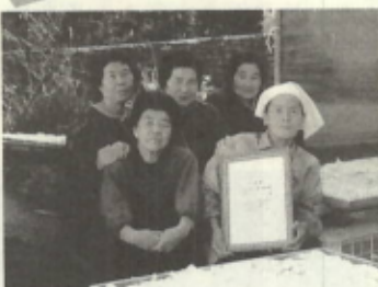
加工組合の皆さん