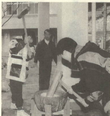
かるがる...とついでベッタン

ました。だから、これからは、今まで以上に勉強をがんばり、自分の行動に責任を持って、健康にも気を付けたいと思います。 特に勉強をがんばって、希望する高校に入れるようにしたいのです。そのため