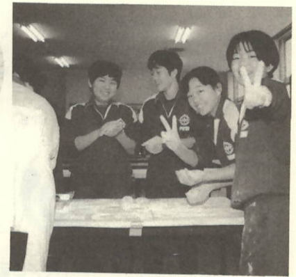
おもちゃをまるめて…まっ白

私は二月三日に少年式を迎えました。それで、私は二つの目標をたてました。まず一つは何事も努力しようということですが、今までの私はいろいろなことで甘えすぎていました。だから