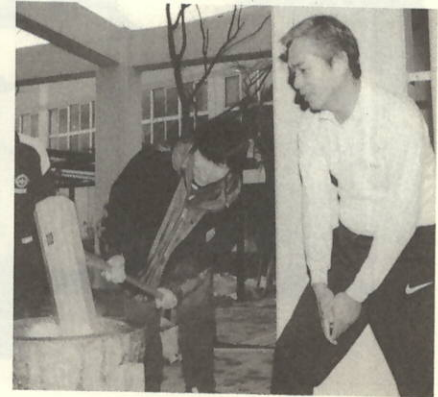
力を出してベッタン