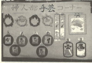
すてきな趣味のコーナーでした