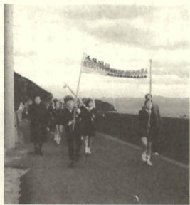
小学校を出発しパレードする児童のみなさん