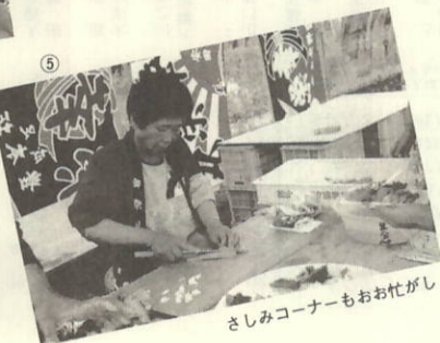
さしみコーナーもおお忙がし