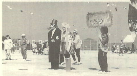
着付け競争 今をときめくセーラムーンR(塩成地区)