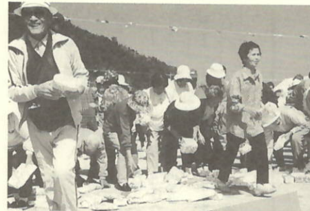
宝もの何が入っているか 楽しみ