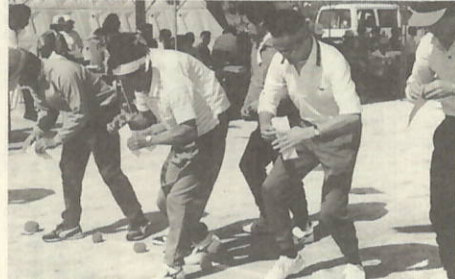
借り物競争 さあカードには 何と?