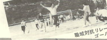
職域対抗リレー決勝 ゴールだ！