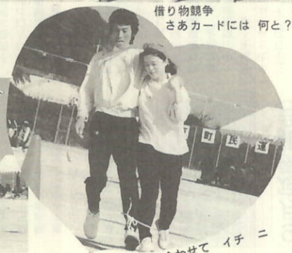
息を合わせて イチニ