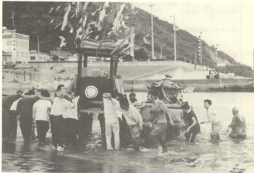
川之浜練り風景…海の中で鉢合わせ