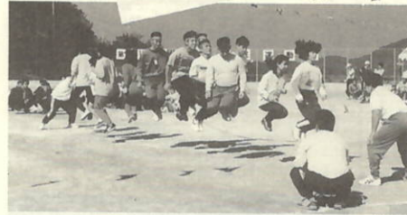
記録への挑戦 みんなでジャンプ