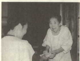
訪問先のおばあちゃんと会長さん

長寿社会の今日、町内の八十才以上の人口が二百四十名程になり、全体の約一割弱となっております。誰もが行く道である老後に少しでも華をと思ひ、敬老週間に併せて九月十九日(火)、栄養推進協議会員で入院されている方を除く約二十七名の方へ届けるおはぎ作りを行いました。 お金さえあれば、何でも手に入る時代、お年寄りの方に喜んでいただけるかとの不安、訪問して届ける人のふれあい等、いろいろ問題もありますが、まずは実行へと思いつきました。 早朝からの準備でしたが、会員が和気あいあいのうちに手早く仕上がり、さすがに栄養を考え、実践している会員の方々と感じしました。 でき上がったおはぎをバックに詰め、各支部の人数に分け、地区に帰って会員が、各家庭に届けて歩きました。私も三机地区のお年寄りの方へ届けに行きましたが、とても喜んでいた