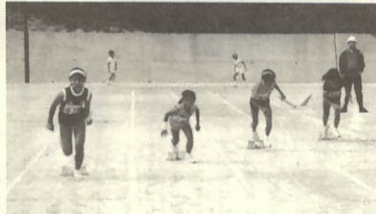
リレーのスタート よ〜い ドン