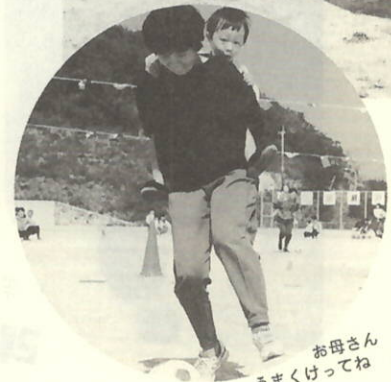
お母さん うまくってね