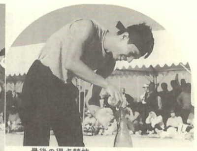
最後の得点競技 ピン詰め…スピーディーかつ慎重に