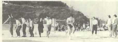
混成350歳リレー バトンをわたして...