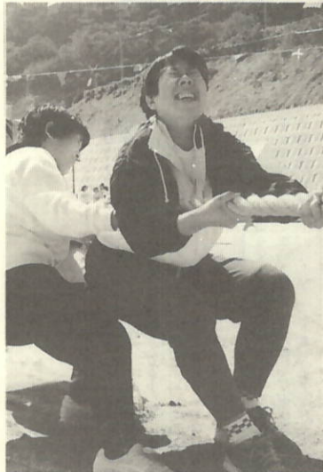
オーエス オーエス このがんばりを見て下さい

さわやかな秋晴れのもと、瀬戸中学校グラウンドで、町民運動会が開催された。それぞれの力を結集し、チームワークを高めて、地区の優勝やチームの優勝をめざして頑張りました。