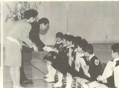
校長先生から教科書をうける児童