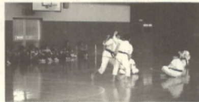
岡山県瀬戸町の少林寺拳法

4月1日(土)、岡山県瀬戸町スポーツ少年団がわが町へ来町。大久小学校児童と保護者及び関係者の協力のもと和舟競技、遊覧船、アトラクション、バーベキューなどの交流をまじえ終始なごやかな雰囲気の中一日を満喫されていました。