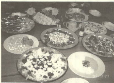
味の研究会…豪華な料理がそろった

構成され、現在の会員数は九十一名です。 また、平成六年度の栄養学級を修了された方は十九名です。この方々にもぜひ協議会活動に参加されるようお願いしています。 今年度も、町民センターで五月より実施していきます。また、栄養学級を修了されていない方で、栄養推進協議会活動にも参加してみようと思われる方はぜひお申し込み下さい。お待ちしています。