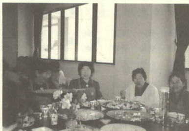
お味は最高。マンゾク