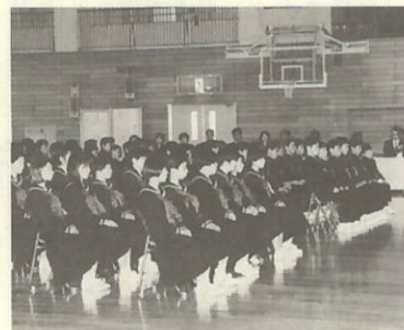
楽しい学校生活を