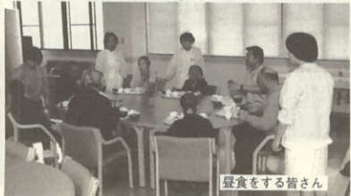
昼食をする皆さん