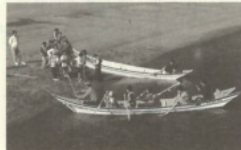
和舟競技の児童たち、気分はいかがでしょう