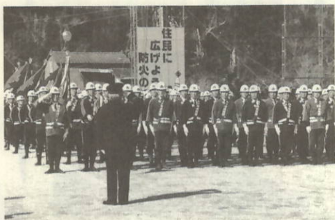
服装点検…各分団のみなさん