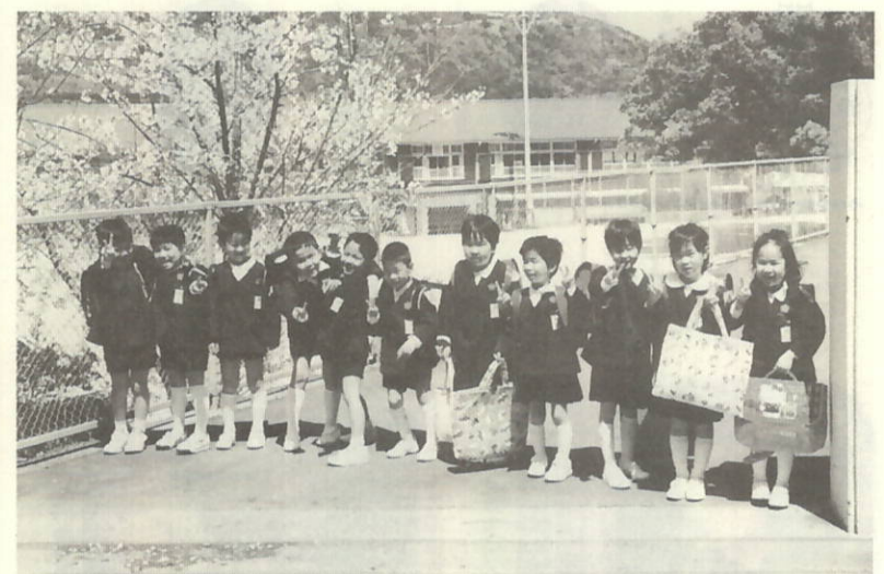
はつらつ1年生登校……三机小学校1年生