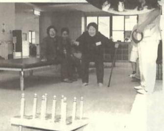
ゲームをとりいれたりハビリ