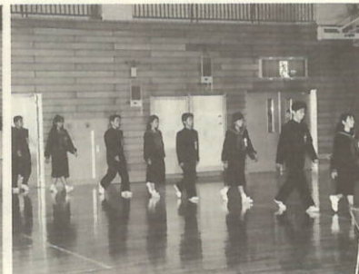
瀬戸中1年生34名の入場です りりしくまっています