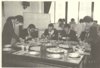
会食する参加者の皆さん。いかがでしょう。