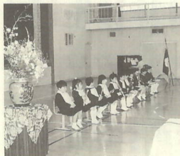
緊張のいっしゅん 三机小新1年生