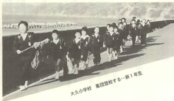
大久小学校 集団登校する…新1年生