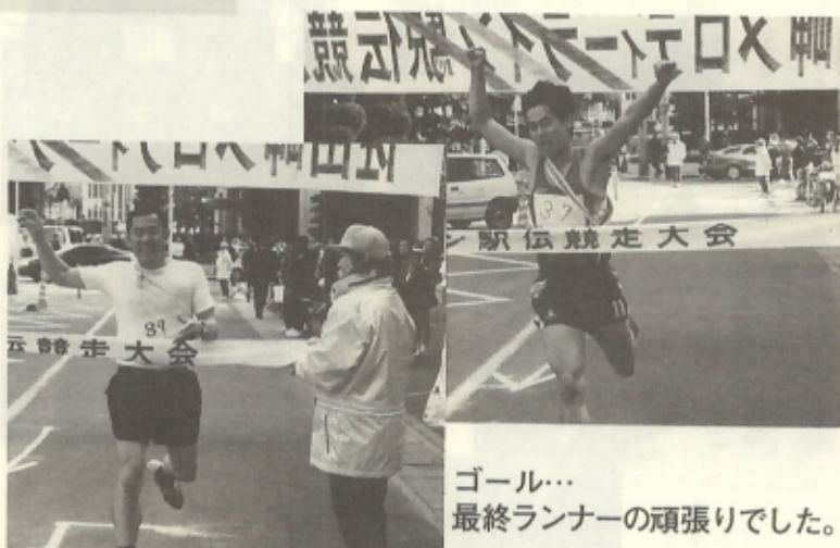
ゴール… 最終ランナーの頑張りでした。