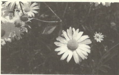
マーマーガレット

で勉強になりプラスになる。一生をかけて大切なものが増えた。 何 でも主人に頼り過ぎていたような気がする。自身をもっとみがいて自立できるように頑張ってみて見たい。 若 夫婦を迎えて、2代と暮らした今までの経験をいかせて仲よくやって行きたいと思う。