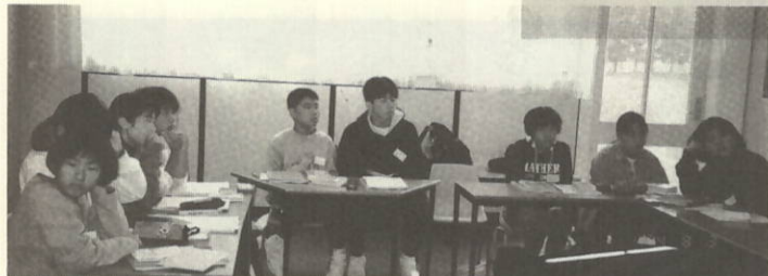
スタディセンターで英会話の勉強