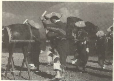
しゃんしゃん踊り