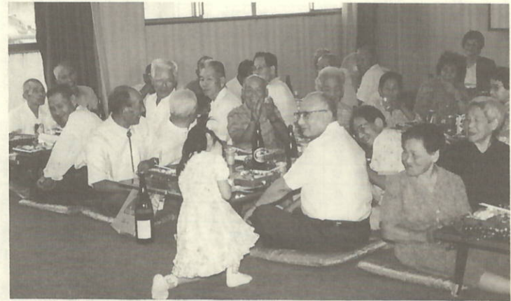
敬老会の催し(大久地区)