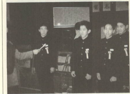
CATVのインタビューの様子(四中)

という誓いを守れるように努力していきたいと思つています。 また、これからはじめのある立派な人間に育っていきたくと思う。そして、クラス目標の飛翔や、少年式で言った誓いを忘れずにいて立派な大人になりたいです。