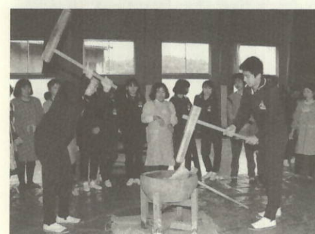
元氣よくもちつき(三中)

く、より魅力的な人間に成長できるような努力をしますと誓いのことばを述べました。少年の日になみ、自分たちで作詞・作曲し「一人一人夢を持ち楽しい時でも寂しい時でも一緒に歩んでいこう、輝く明日を信じて(歌詞の一部)」と少年の日の歌を披露しました。 その後、一人一人が決意発表をしました。式が終わり生徒全員で、もちつきに汗を流していました。又、四 す。四ツ浜中学校の人達と協力して立派な校風を作っていきたいと思っています。 「立志」将来は電気関係の仕事をしようと思つています。その夢を実現するために、まずは高校入試突破を目標に勉強したいと思つています。 「健康」部活動などを通して心身を鍛えたいと思つています。