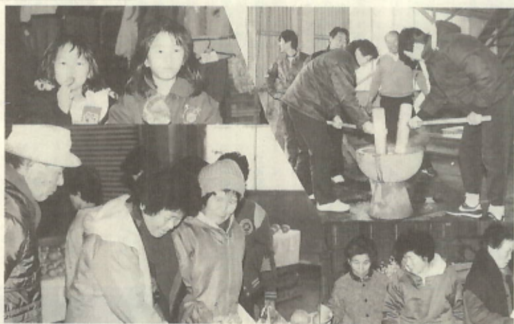
2月11日 農産物共進会 (三机選果場)