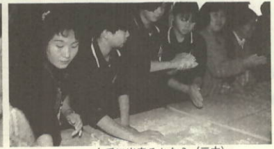
上手に出来るかな?(三中)