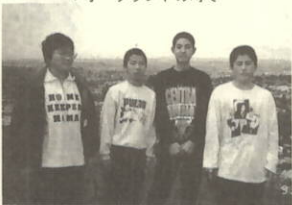
▼オークランドの町で

KATIまで行きました。KATI KATIのステディセンターまで行くことができました。先生方には、きちんと自己紹介するよう言われていたけれど、相手がいきなり英語をしゃべってきたので、緊張して自己紹介することができませんでした。いちばんおもしろかったのは、ロトルア観光でした。それと、温水プールがおもしろかったです。ホームステイの生活も慣れてくるととてもおもしろかったです。いちばんおもしろいのは、英会話でした。