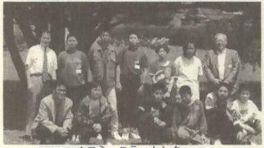
▲コミュニティセンター