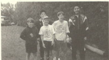
▲MATAHURI RD SCHOOL

十一月十四日僕たちはニュージーランドに向けて出発しました。飛行機全部で十八時間かけてニュージーランドにつきました。僕たちがホームステイしたカティカティとタウランガという町はニュージーランドでも一、二の小さな町でした。僕が二週間のホームステイで感じたことは、自然の豊かさ、そこに住む人々の明るさでした。二週間の研修の中で一番心に残っていることはホストファミリーと住った休日です。二日間の休日日本語は使えませんが、辞書をひきながら話すのが楽しく言葉に関する不安などそのころの頭の中にはありませんでした。普段の生活の中で困ることはなく食