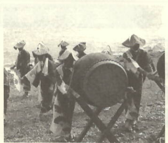
しゃんしゃん踊り (大久)