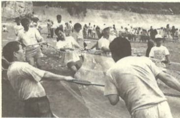
ヨイショ ヨイショ

地引網を終え、早速漁港で採れたての魚をメインにバーベキューが始まり、地元の人達による手作りのおいしい焼とうもろこしなど炭火を囲んで海の幸に満足顔でした。また、子供相撲大会がおこなわれ土俵の周りには多