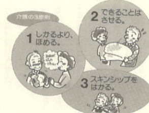
献血方法別の採血基準

に携わる家族の方々は苦労も多いことと思います。家族だけで抱えます、お気軽に御相談下さい。痴呆老人も一人の人間として尊重されるのが大切です。そのためにも、周囲の方々との協力をお願いします。次回は十二月三日(金)、田部集会所で予定しています。