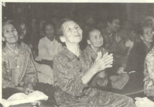
9月15日 敬老会 (田部)