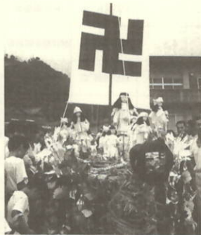
おしよる舟 (川之浜)

9月1日大久の於幾世里大明神のある先成とワキムラで、しゃんしゃん踊りが奉納されました。伝統によると昔(於幾世)の霊をなぐさめるため始められたと言われています。