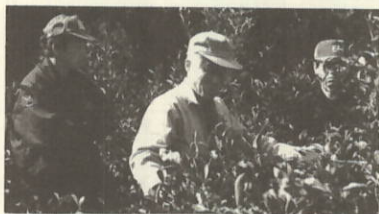
剪定間伐実習風景

瀬戸町農業公園 建設省「道の駅」に認定 建設省は四月二十二日、ドライブ途中の休憩や情報交流の場となる「道の駅」に、瀬戸町農業公園を含む全国百三カ所を選び、登録証が交付されました。 「道の駅」は無料駐車場やトイレ、電話、ファックスなど備えた休憩所、地域の歴史や特産品などを紹介する案内所として、主要道路沿いに整備する。二十四時間利用可能であること。