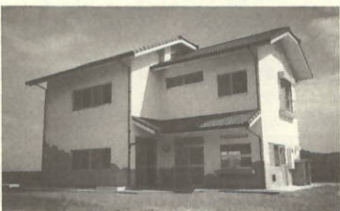
須賀観光休憩施設

まずので大切に使用願ひたいものです。休憩所の使用料金は、次のとおりです。 五人まで 一日につき 六、〇〇〇円 一人増すごとに一日につき 一、〇〇〇円