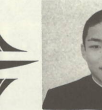
特選 一点 三机中学校 佐々木 真

の統合を波にイメージして上下に配し、波の先端は限りない発展を表わすと共に中央にカタカナと漢字で「七ト申」と記したものです。