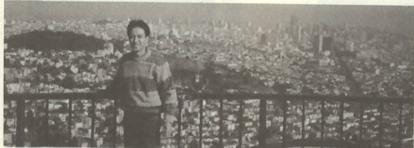
サンフランシスコ

会、友達等いろいろなものがあると思います。でも、日本では変えようとしてもどうしようもない環境もあります。しかし、アメリカの環境であれば、たとえ短期間でも日本の子どもにとって、将来プラスになることが多いと思います。では、アメリカの家庭はどのようなものになっているのでしょうか。これは、シアトルの中流家庭一例です。庭は広く（大型のバスがリターンできるくらい広さ）馬を飼っている家庭もあります。家の中は、子どもと親の部屋が完全に独立しており、バス・トイレさえも分けている家もあります。子ども部屋に人形がたくさんあったのは、広い部屋で一人であるのが淋しいのでしょ。この様なことが良い、悪いは分かりませんが、でも、子どもが自己主張でき、積極的に物事に取り組むのは、分かる気がしました。人を頼る前に「まず自分で」ということが、小さい頃から身に付いているのではないのでしょうか。とは言っても、この様な点だけをただ取り入れればよいのではないと思います。日本には、日本の良さがあるのですから。