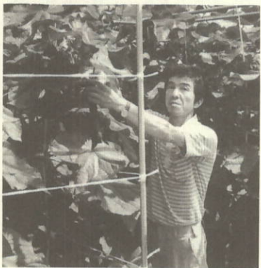
すくすくと育つきゅうり

四月一日播種のきゅうりが順調に成育し、五月十五日初収穫をむかえる事ができました。一日、15cm×20cm成長し、現在温室一杯に繁茂しています。今後、子づる、孫づるを収穫し、七月五日頃栽培終了の予定で、メロン収穫は七月中旬の見通しです。第2作はト