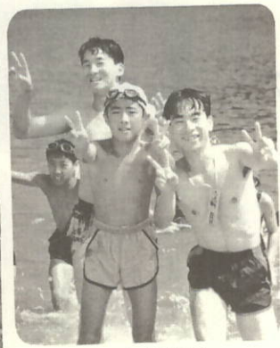
いっしょに水遊び

八月五日から十日にかけて、松山市の大学生で組織されているVYS連合会と三机小児童の交流が行われました。