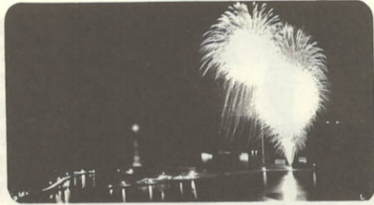
三机港を花火が飾る