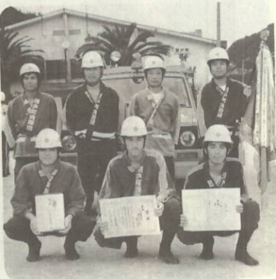
堂々の優勝 第九分団のみなさん

八幡浜・西宇和地区の消防操法の技を競う、八西消防操法大会が、七月二十八日(日)伊方中グラウンドで開催されました。