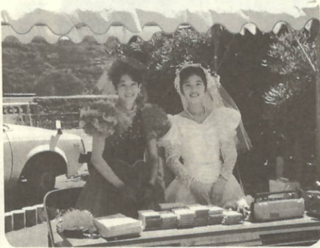
楽しんで下さいね!と花嫁さん