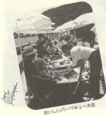
おいしいバーベキュー大会