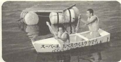
見事優勝 三机中パレー部