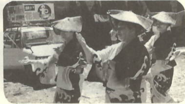
岡山県瀬戸町のご婦人も参加