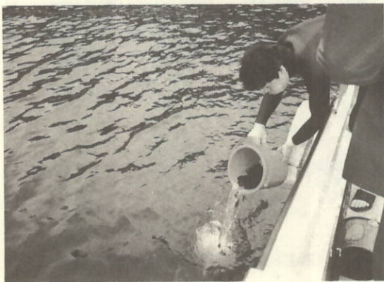
願いを込めて放流