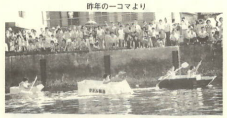
昨年の一コマより

三机、須賀公園をメインに行われている瀬戸の花嫁まつり91も開催まで二週間あまり、皆さんお待ちかねのイベントの季節です。イベント実行委員会を中心に関係団体と協力し合って、企画・準備の真っ最中です。