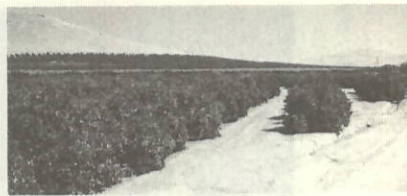
雄大なアメリカ大陸