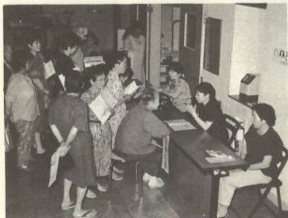
おばあちゃん 元気ですね。

7月13日(土)、「自分でつくる自分の健康」をテーマに、第5回瀬戸町健康まつりを開催しました。各コーナーに参加者が集まりましたが、中でも、体力測定、健康相談、葉草展試食といったコーナーには多くの方が参加され、にぎわいました。