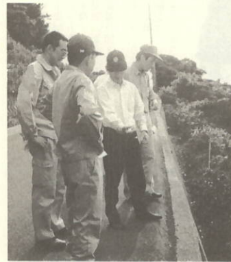
大忙しの役員さん

畑地かんがい事業は、樹園地内に専用パイプを配管してスプリンクラーを設置。農薬散布や散水などを自動で行うものです。七月十五日、午前六時から地区の役員さんら十数名