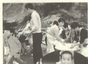
昼食はカレーライス

三世代が連帯感を深めて助けあいの中で、長寿社会に対応しようと企画され、三机地区体育館で開かれた交流会には、約百七十人が集いました。