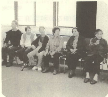
体を動かすことが一番

九・十月は各小中学校の運動会、町民運動会が実施されました。体と心の障害をもつ者、その家族もみんな仲良く、体を動かしたり笑ったりと、十一月五日町民センター内で運動会を実施しました。