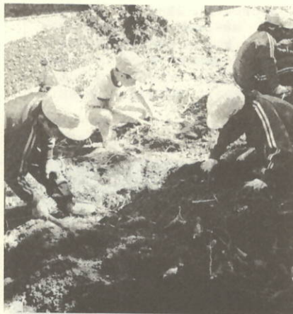
おイモさん 見つけた

きょうは、楽しみにしていたいもほりです。わたしは、三ばんで五年といっしょでした。いもをほりました。大き