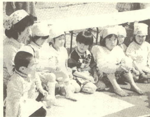
おもち早くつかないかな～。