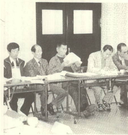
熱心に聞きいる区長さん方

去る四月二十七日、各区の区長さんと町の執行部が、行政運営についての意見を交換する区長会が役場において開催されました。席上町長はあいさつの中で、今年度においては、町の基礎である第一次・第二次産業の強化、またリゾート開発、福祉のまちづくり