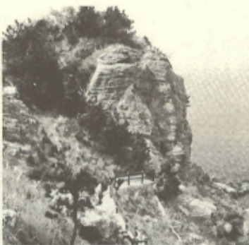
瀬戸町の一番西の端に突出している番匠鼻。岩礁が連り、磯釣りの漁場として知られている。ツツジ、サクラ等が植えられ、行楽地として親しまれている。