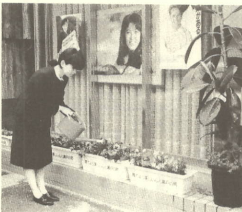
きれいな花にお水を。

まればと思います。美しい町になつてほしいとだれもが望んでおり、瀬戸町へ行けば、花がいっぱいだよと思われようそんなままづくりもよいのでは。