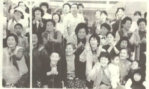
がんばれー、応援団