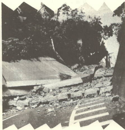
堀切付近のがけ崩れ