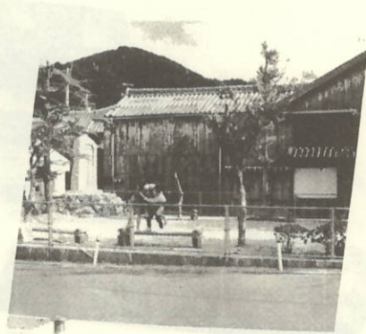
三机みんなの広場事業