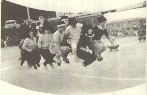
みんなでジャンプ!