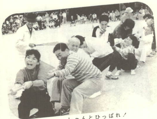
しゃんとひっぱれ!