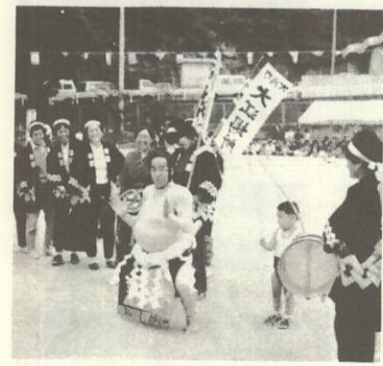
どすこ〜い! (大江・志津・小島チーム)