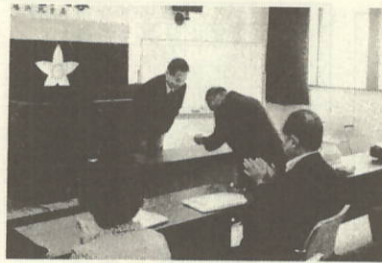
修了証を受けられる受講生

愛媛県八幡浜地方局主催の「愛媛県地域高齢者大学（第7期課程）」が九月十二日閉講式を迎えました。この高齢者大学は、瀬戸町と三崎町の高齢者を対象に、昭和六十三年十月から平成元年九月にかけて、延べ十八日間にわたり、講義と施設見学が実施され、高齢者の学習の機会確保と社会参加促進のため開催されていたもので、本町からは、