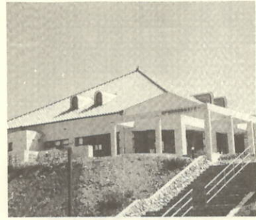
スパニッシュな建物

「風の名所」掘切で去る八月九日(水)農業活性化センターが堂々オープンしました。八月の観光シーズンでもあり、町内外から続々とお客さんが訪れ、にぎわいをみせていました。 このセンターは、農山村地域活性化緊急特別対策事業の一環として、七月三十一日に完成、総事業費一億円、堀田建設(株)が建設に着手してまいりました。地域特