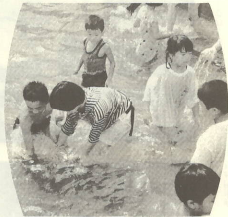
まつりの一コマ (魚のつかみどり大会)

八月六日(日)に行いました「瀬戸の花嫁まつり'89」につきましては、皆様方のご支援、ご協力により、盛況の内に終了できましたことを心からお礼申し上げます。 このイベントも来年は五周年を迎えます。地域住民のパワーとアイデアを結集し、すばらしいまつりとなる