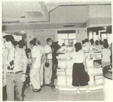
週末はおお忙しです!