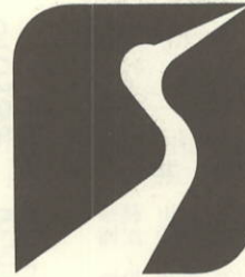
(高齢者交通安全マーク)

ご希望のかたは最寄りの警察署(派出所・駐在所)及び地区の交通安全協会にお問い合わせください。