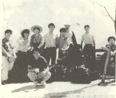
ゴミ袋もいっぱい

午前七時から町内全域にわたり、ゴミというゴミを集め、トラックに何台分もの収穫がありました。 これからも、町内の婦人が力を合わせて行事等に取り組んでいこうと意気込みをみせていました。 おばちゃんら、がんばっちゃよ！