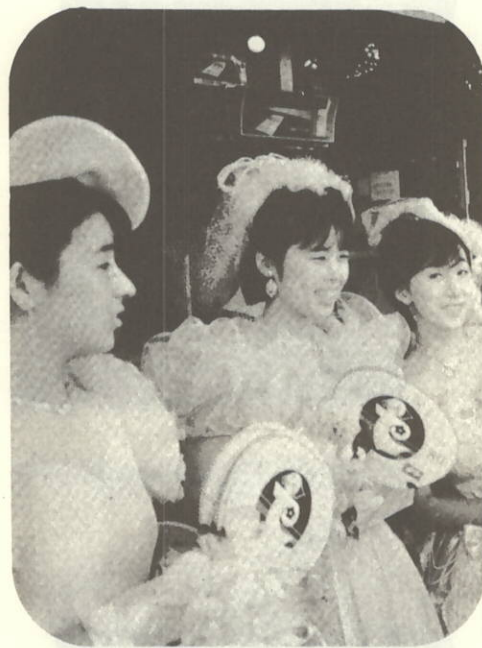
お待ちしております 笑顔でキャンペーン3人娘