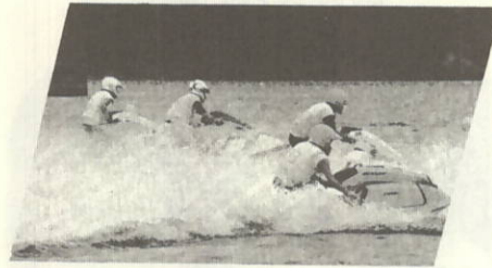
ジェットスキーってかっこいい！