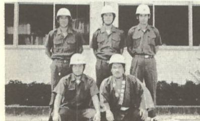
小型ポンプ優勝第1分団