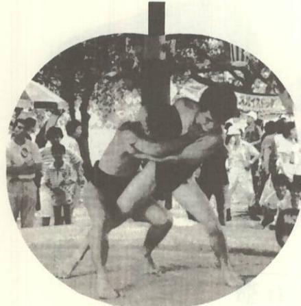
できたての 相撲場で 真剣勝負

このほど、大久展望台の公園施設として、みごとなワシントンヤシ4本・ソテツ8本が植栽されました。 この事業は、宝くじによる緑化推進コミュニティ助成によるもので、総額は百万円。 12本のフェニックスが、道行く人の心を和ませています。展望台に立ちよる観光客もますます増えることでしょう。