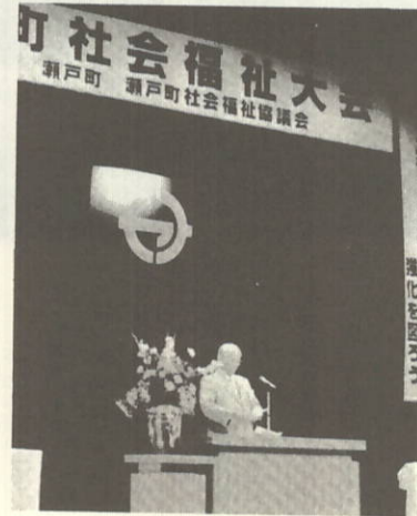
高齢化の問題を語る町長

なお、急患センターは市立八幡浜総合病院内にあります。特に、日・祝日は、自病院で診療することがありますから、あらかじめ電話で確認して下さい。