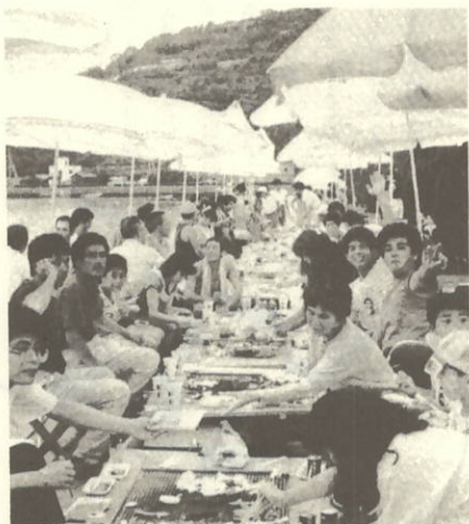
「ウーン」バーベキューは最高だ!!