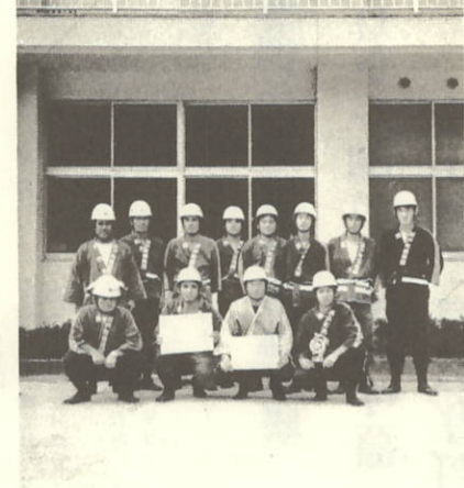
おしくも優勝をのがした2位の第9分団