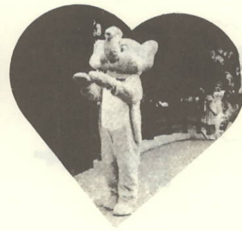
ゾウさんも瀬戸音頭