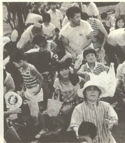
こっちもまいてや