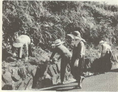
きれいになりました

午前七時から町内全域にわたり、ゴミというゴミを集め、トラックに何台分もの収穫がありました。 これからも、町内の婦人が力を合わせて行事等に取り組んでいこうと意気込みをみせていました。 おばちゃんら、がんばっちゃよ！