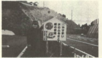
消防署第一分署前に設置した山火事防止用看板

これから春先にかけて、空気が乾燥し、風の強い日が多く山火事の発生しやすい時期です。消防団と消防署第一分署では春の大災予防運動の行事の一環として、ハイカー等の入山者、森林所有者、林内での作業者をはじめ広く地域住民に火災予防思想の普及と、豊かな森林資源を火災から守るために、町内3ヶ所(元ゴミ焼却場三差路、高茂四差路、消防署第一分署前)に、山火事防止用看板を設置しました。みなさん、ひとりひとりが注意して大切な緑の資源を火災から守りましょう!!