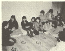
熱心なまなざしに、語り手にも力が入ります

その中でも一番心に残っていることは、七ツ竹遊びです。竹を七本もらった時、これは何をやる物だろうと不思議に思いました。どうやってすればいいか分からない時、おばあさんがとてもやさしく教えてくれました。私は初め下手くそだったのに、おばあさんが、とても分かりやすく教えてくれたので、きれいにやることができました。まったく知らない遊びを、とても分かりやすく教えて下さって本当にありがとうございました。