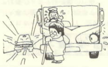
車の運転・乗車の場合はやめよう