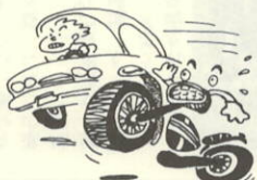
春の全国交通安全運動 (4月6日～15日)