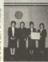
受賞された日の会役員の皆様

同母の会は、春・秋の交通安全週間、交通茶屋を開き、毎月二十日には、街頭で交通安全指導にあたる等の交通安全防止の啓蒙活動や、道路の清掃や沿道への花植栽等の地道な活動が認められたものです。