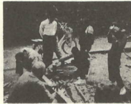
トンボ作りは、まず青竹割りから...

老人クラブ活動の一環として、三机地区の弥生会と松寿会の会員の皆さんが合同で取りくまれているもので、三机小学校の児童の皆さんが大勢参加しました。