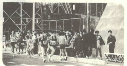
3区→4区中継点(伊方ビジターズハウス前)