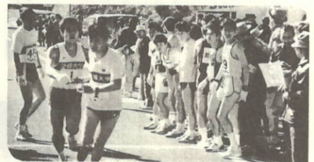
1区→2区中継点(コスモ石油スタンド前)