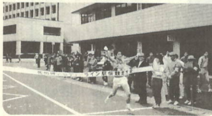
ゴール(八幡浜市白浜公民館前)