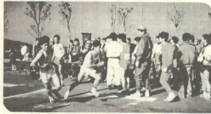
2区→3区中継点(堀切大橋)