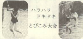
ハラハラ ドキドキ とびこみ大会