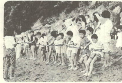
今日はたのしい地引きアミ