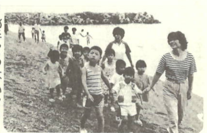
月あそびつなりのり