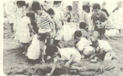
大物に見入るかお・カオ・顔 サカナに群がるチビッコたち