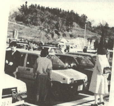
人と車であふれそうなポケットパーク

国道197号頂上線が12月4日、全線開通して佐田岬半島に新時代が到来。半島がグリーンと近くなった。今、新しい道路と自然が豊富で風光明媚な半島を求めて連日マイカーで多くの人が押し寄せている。堀切大橋ポケットパークには、南に向かって開けた静かな宇和海を眺める若いカップルや橋をバックに写真を撮る光景がみられるなど多くの人でにぎわう。 先の通行量調査によると堀切大橋付近を通過した車の台数は午前8時から午後6時までの10時間で流入、流出合せて4,407台。以前とは比較にはならない。それはポケットパークのゴミの量でもわかる。 しかし、今は人が多く訪れてくれることのメリットがほとんどない。このメリットを最大限に生かすような方策を考えなければならぬ。