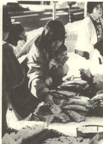
家族づれの人たちが大繁盛!!