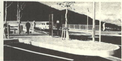
メロディーボックスがつけられる堀切ポケットパーク

風力利用のメロディーボックス付観光案内板が設置される。この案内板は高さ約四尺、横二・五尺。最上部に半球形のカップをつけた三本の回転翼があり、風を受けて回転するとボックスのスイッチが入り、直接ボックスから音楽が流れる。佐田岬半島は風が強い。これまで強風はやっかいものであった。しかし、近年いっそ風を観光に利用できないものかとの声が上がっていた。設置費は五百万円。全部で五基設置、内四基はメロディーなしのものとなる。予定では今年度末には完成。新しい観光名所となることが期待される。