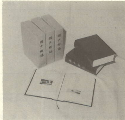
▲出来上がった瀬戸町誌

の八編からなっている。特に写真、図表をふんだんに使用、原始から現代までの歴史と産業、文化の伝統などを詳しく載せてあり、郷土の文化や生活の跡が一目でわかる。また、各地区の民俗、伝統、地名の由来などがこれほどと、これを集大成したもので、明日の瀬戸町発展の礎として、活用するに値するものとする文化遺産となるもの。このたび出来あがった町誌は、A5判(縦×横)で、二ページ厚さ(厚さ)のもので、「自然」、「歴史」、「行政」、「産業・経済」、「教育」、「宗教」、「民俗・文化」、「人物」