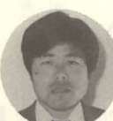
三机 中 学 校 教諭 三机 中 学 校

常に自分をより返り、みつめることのできる生徒をめざすと同時に、私自身も学びつづけていきたいと思ひます。よろしく、お願いいたします。