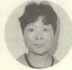
頭より 征子 教小 串 小林

「物に榮えて、心に滅ぶ」おろかさを繰り返さない教育を実践したいと考えています。学校には、土日には、かつて大先輩校長が述べられたように、私共の意を体し、明るくあたたかき、声高らかに校歌を歌う子ども、地域社会の期待にそうよう「心の教育」に努力したいと思ひます。