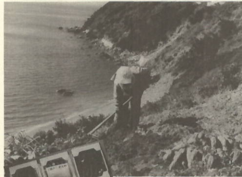
瀬戸の金太郎(甘藷) ▲瀬戸の気候と土壌を駆使して作られた味は天下第一品

材料に菓子を試作したと報じている。この菓子は、四ツじりにした夏カンの皮、約一センチ幅で切り、二、三度じっくりとゆがいた後、同量の砂