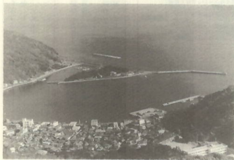
日本のパルハーパー 地域活性化の核に……