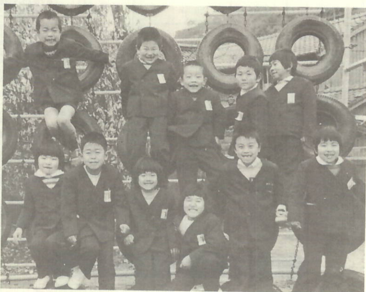
塩成小学校1年生のみなさん