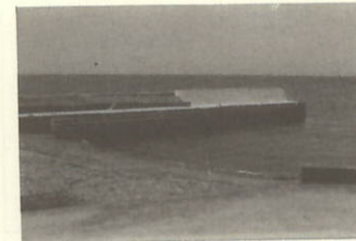
西小島(松之浜)漁港局部改良