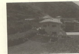
塩成教職員住宅建設