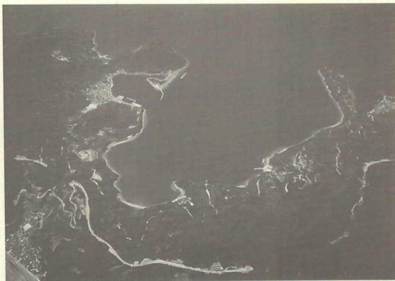
はるか上空より瀬戸町を望む