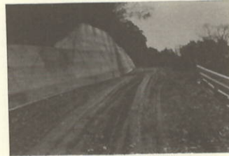
町道田部中央線新設