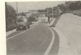
上倉中央線改良舗装