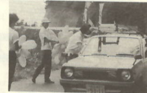
交通安全茶屋(交通安全協会四ツ浜支部)シートベルトしめてください

みなさんが心をこめて作った安全祈願のお守りを配り、交通安全を呼びかけた。また二十五日、塩成小学校において瀬戸駐在所から交通安全旗が贈呈され旗の説明を受けた後、旗の掲揚、全校児童五十二名による鼓笛隊パレードが実施された。その他大久小学校・川之浜小学校においても鼓笛隊パレードが行われた。交通安全は、子供・家族・みんなの願いです。どう取り組むかは、ドライバー一人ひとりの問題。ドライバー一人ひとりが、交通ルール、マナーを守り明るい瀬戸町にしましょう。