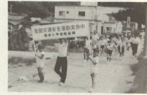
塩成小の鼓笛隊パレード

九月二十一日から三十日まで秋の全国交通安全運動が、全国一斉に展開された。本町においても、交通安全の願いをこめてさまざまな行事がおこなわれた。交通安全運動の初日には、瀬戸・四ツ浜支部で交通安全茶屋を実施。