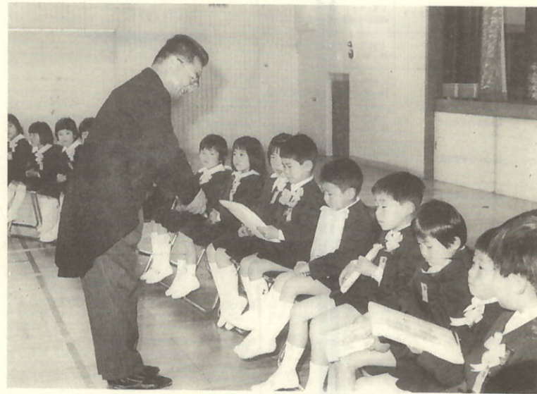
三机小学校入学式 4月8日

No.146 昭和60年4月20日発行 発行所 瀬戸町役場 ☎0894(代)52-0111 〒796-05 愛媛県瀬戸町三机 編集企画課