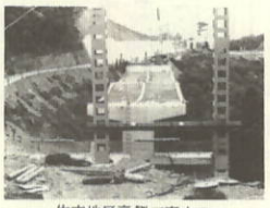
佐市地区裏側工事中の二見第一橋(伊方町側)

一九七号の進行状況は、我々佐田に住むものにとつて最大の関心事である。今年も概数ではあるが本号で取り上げた次第。 長年の悲願であり、後進性からの脱却を図れる。夢であった。高速道路が建設工事のつち音高く着々と完成に向かつて進行している。