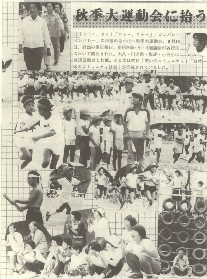
秋季大運動会・区民運動会

「ヨーイ、ドン」「ワー、ワー」「ガンバレ ガンバレ」の声援のるつぼ～秋季大運動会。9月18 日、同25の両日曜日、町内各園・小・中運動会が各校区 において開催された。大久・川之浜・塩成・小島小は 区民運動会と共催。そこには終日「笑いのコミュニティ」「自然 体のコミュニティ社会」が形成されていました。