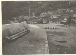
昭和39年頃の川之浜の西附 近護岸ができました。