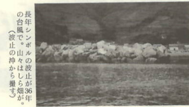
長年シンボルの波止が36年の台風で。山々は煙が。波止の沖から撮す。

小島峰の小草山に群生しているすすき。昔と同じく牛の飼料だが今は高茂で放牧している。三崎牛のえさ。(十月十二日撮影)