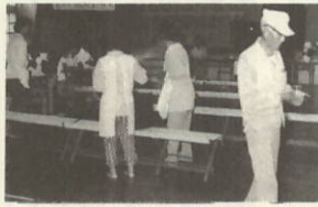
三年前の参議員選挙(四ツ浜中の講堂で)

公職選挙法の一部が改正され六月の参議員選挙から変わります。 今回の改正により、参議員議員の選挙は都道府県を単位とする選挙区ごとに選挙される選挙区選出議員(二五二名)が、いままでの地方区と、政党その他の政治団体に投票された得票に比例して選出される比例代表選出議員(一〇〇名)が、いままでの全国区(一〇)選挙から構成されます。