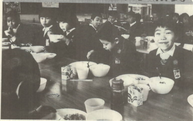
給食センターの食堂で 三小児童