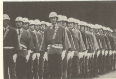
規律訓練は大久分団 きまっています、指揮は仲口分団長