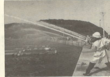
須賀防波堤から内港へ向かって一斉放水中 一般の人もマイク放送で周知した結果多勢 見学をしました。(手前は三机分団)