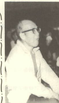
泣きの場面 (文楽のクライマックスで)