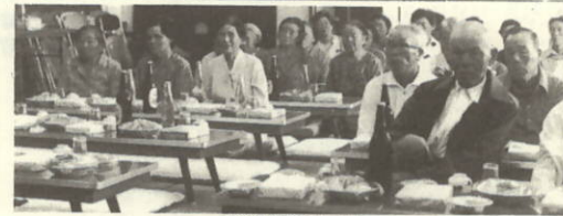
祝辞を聞くおとしより