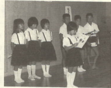
作文を読む小学生

今年も恒例の敬老会が九月十五日を中心に各地区の公民館や集会所でおこなわれました。敬老会には町内の七十歳以上ののおとしより、五百八十九人が参加。敬老式では町長や、区長さんのあいさつのおと、今年、金婚式を迎えた方、米寿を迎えた方に祝いの品が又、塩成の砂浜