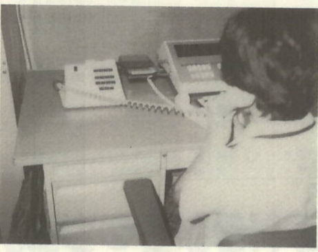
交換室にある無線電話

大規模な災害に備え九月一日から、役場に、防災用無線電話が設置されました。 この電話は災害により電話線のケーブルが寸断されても、県庁を統制局とし、各地方局と市町村とを無線電話で結び、連絡 や救助対策の際に役立たせようとするものです。役場には町長室の外4ヶ所に置かれており、普段はこの電話により県庁や各市町村間の連絡にも利用できるものです。