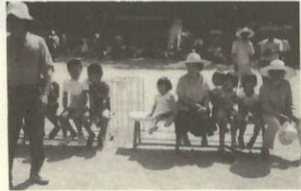
お母さんがんばって!!

当日は雲一つなくカンカン照りの中選手はもとより応援団も汗だく、「オチツケ、オチツケ」「ファイト、ファイト」と地区を代表しての選手に、声援を飛ばす人、かたずを飲み心の中で応援する人、お父さん、お母さん