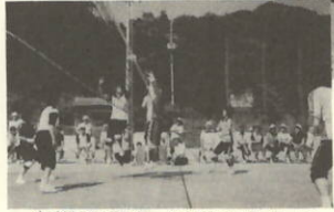
気合を込めエイ!!(大久A対三机A)