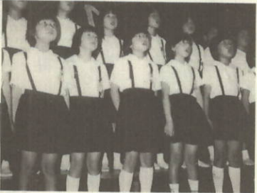
いのちのうたを大きい声で 一生懸命合唱する三机小