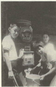
きれいになった郵便ポストと汗を流す、よい子のみなさん

立ちんばうのポストよりありがとらう七月十八日午後一時から児童生徒が町内に分散している15組のポストのあかを落しました。