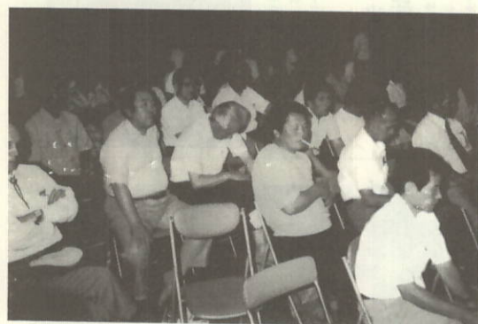
チャンスとばかり熱心に懇談

「で手術」とか植物人間化した我々の交通地獄そのもの。女性はもが娘に家族が看護する場面がカとより一部男性もじつと下を向