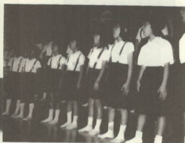
NHKの課題曲を合唱する 大久小