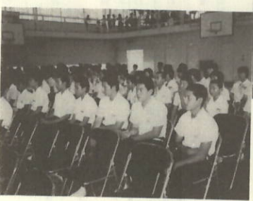
しんみょうに聴く生徒