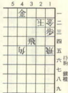
5分中有段者、10分中2級