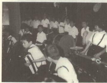
幕あき前の一コマ、ドキドキしてます 塩成小