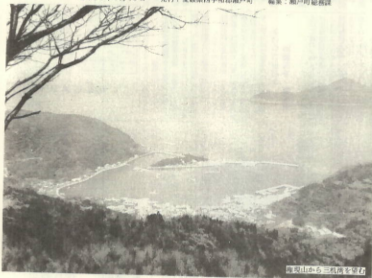
梅現山から三机湾を望む