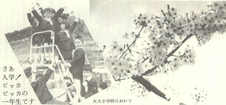
さあ入学！ ビッカ ビッカの 一年生です