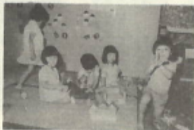
[塩尻保育園において]

がいますが、子供にしてみれば「耳だけ」になったほめ言葉からは何の感動も受けません。むしろ、褒めばいほめ方はつしみたいものです。態度で心の底からはめてやると下さい。どの程度はめてくれるのか。子供は敏感に親の気持を感じています。子供は、いつも親から愛されたい、認められたいと無意識のうちにそう願っています。子供ならだれしもよい子になりたいと思っています。