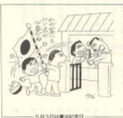
5月3日は憲法記念日