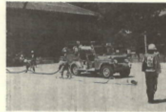
(町 大 会)